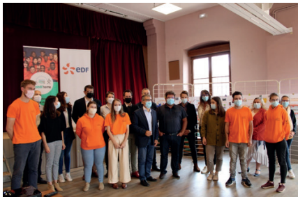
Journée de lancement Mobili'Terre 63