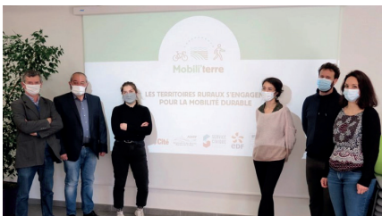
Journée de lancement Mobili'Terre 81