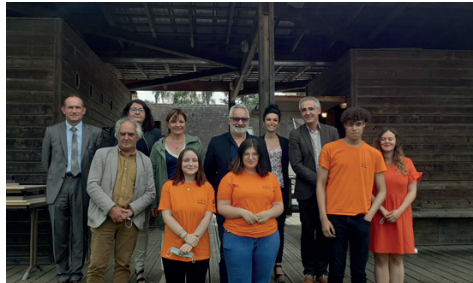
Journée de lancement Mobili'Terre 72