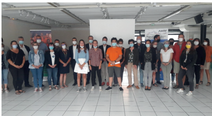
Journée de lancement Mobili'Terre 74