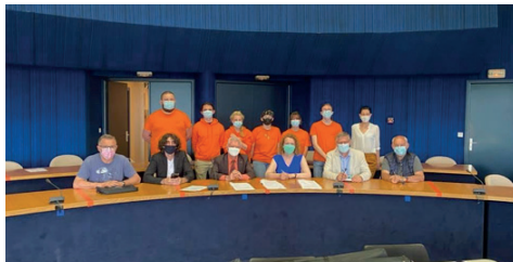
Journée de lancement Mobili'Terre 45