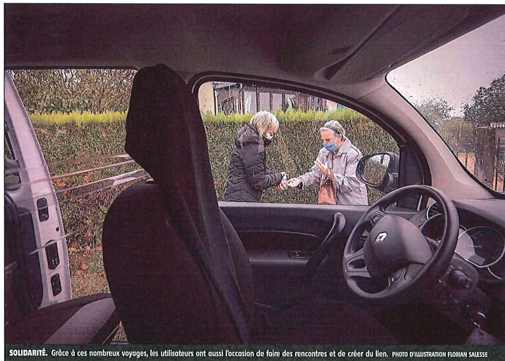
SOLIDARITÉ. Grâce à ces nombreux voyages, les utilisateurs ont aussi l'occasion de faire des rencontres et de créer du lien.

Depuis son démarrage en novembre 2022, le dispositif de transports solidaires de la communauté de communes Chavanon Combrailles et Volcans attire de plus en plus de bénéficiaires. Si pour l'instant, le nombre de bénévoles est stable, l'équipe de Tous mobiles espère renforcer son équipe de conducteurs.